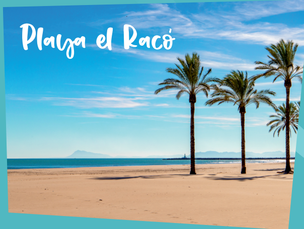
Playa el Racó