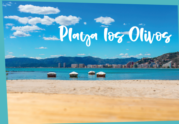
Playa los Olivos