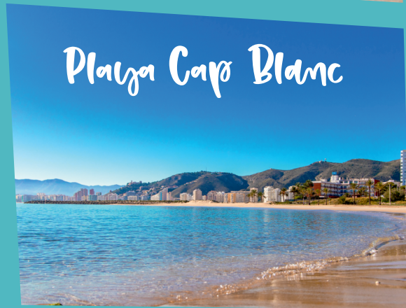
Playa Cap Blanc