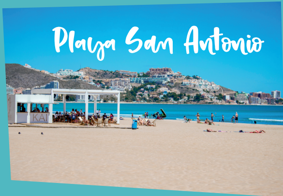
Playa San Antonio