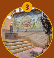
Fuente de la Piña