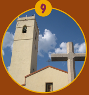
Iglesia de San Miguel y Plaza