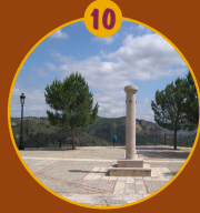
Plaza de la Picota