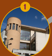
Tourist Info Jalance