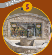
Fuente del Médico