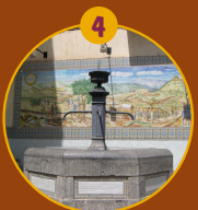
Fuente de los Cuatro Chorros