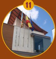
Casa del Arco y Plaza del Ayuntamiento