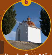
Ermita de San Miguel