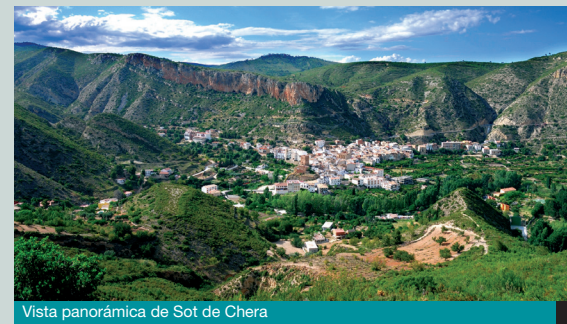
Vista panorámica de Sot de Chera