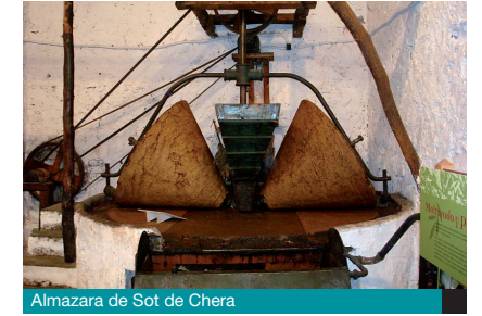
Almazara de Sot de Chera

Construida extramuros de la población, se trata de una iglesia del S. XVII, de concepción neoclásica. En su interior se conserva un Sagrario-Tríptico, del siglo XVI, atribuido a Juan de Juanes.