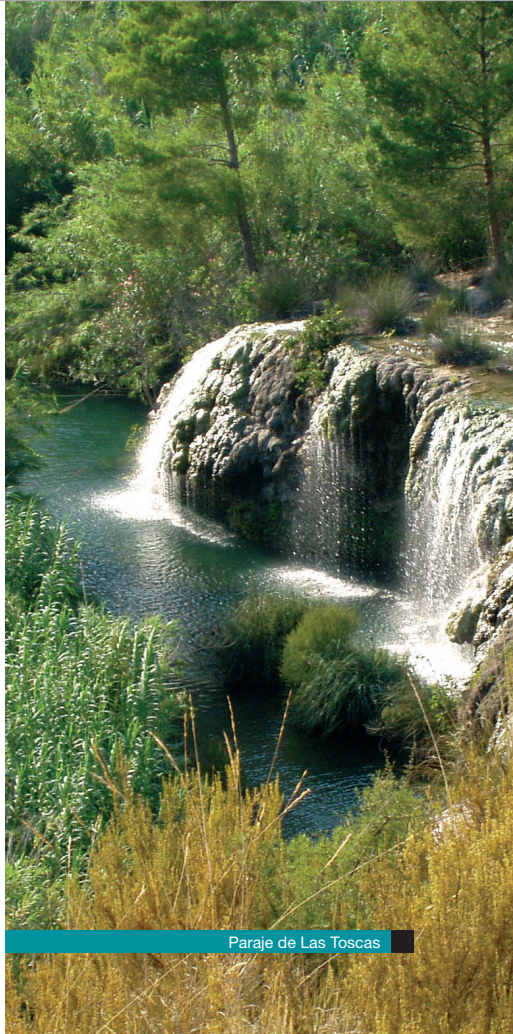
Paraje de Las Toscas

Somos un municipio abierto, alegre, hospitalario, donde nadie se siente extraño, nuestros atractivos harán de su estancia en Sot de Chera el destino perfecto para sus vacaciones.