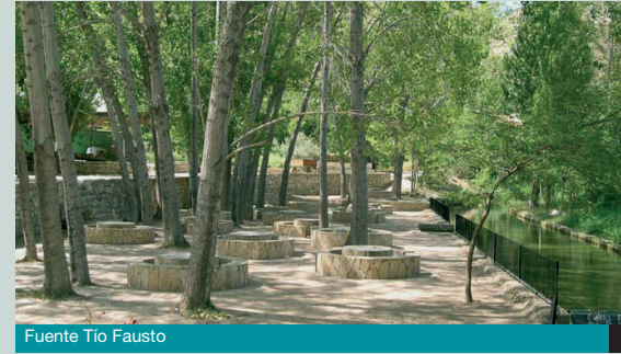
Fuente Tío Fausto

En el término municipal de Sot de Chera, dado lo abrupto del terreno, abundan los manantiales, contando el término con 52 nacimientos. Entre los más visitados tenemos la Fuente de Santa María, Fuente Fetge, Fuente de Masalucas, Fuente del Pocillo, Fuente del Ramblizo, la Palomera y el Tío Fausto. A muchas de ellas se le atribuyen propiedades terapéuticas. Algunas están habilitadas como áreas recreativas.