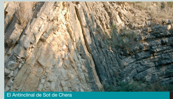
El Anticlinal de Sot de Chera