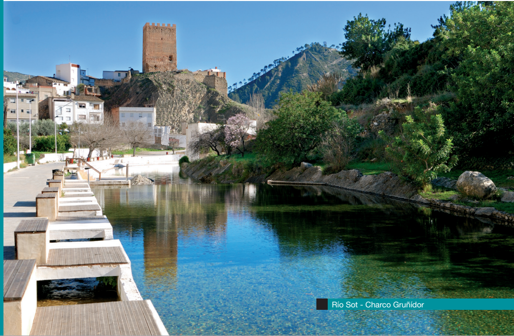
Río Sot - Charco Gruñidor