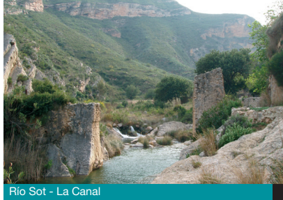
Río Sot - La Canal

Es un recurso importante en la localidad, destaca el Río Sot , que con una longitud de 12 kms. aproximadamente, es afluente del Turia por la derecha. El río Sot cruza el municipio y pasa a escasos metros del mismo, de curso regular y encajado en un sistema rocoso, logra que se formen atractivos y bonitos paisajes como el paraje de Las Fuentes , donde renace el río, la Canal , donde el río forma balsas naturales de gran belleza, rodeadas de frondosa vegetación y de los restos del acueducto árabe que lo cruza. A pocos metros del núcleo urbano cruza el río, que se embalsa y crea piscinas naturales aptas para el baño y muy visitadas tanto por los vecinos como por los turistas, tramo conocido popularmente como "Charco El Gruñidor" .