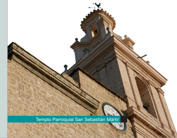
Templo Parroquial San Sebastián Mártir

Sala José Fabuel "El Herrero" en la que las miniaturas toman importancia, reúne más de 200 piezas de gran perfección de forma, realizadas en hierro y esparto, que componen una colección única a través de las que se recuperan oficios y costumbres locales tradicionales perdidos o transformados. Realizadas a mano, cada una de las piezas es única. Nos encontramos ante una singular manifestación de cultura material de evidente interés antropológico y etnológico.