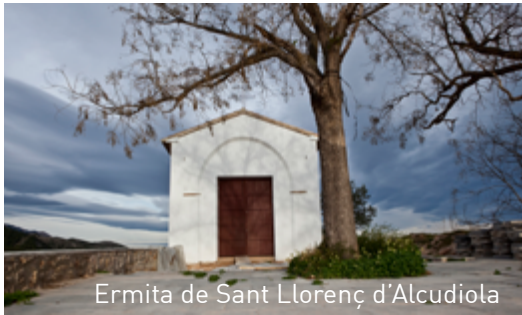
Ermita de Sant Llorenç d'Alcudiola