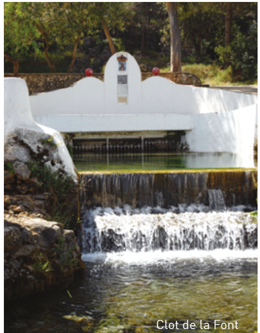
Clot de la Font

El riu Vaca travessa la vall i l'horta del terme, dotant els nostres cítrics d'un sabor i una textura incomparables.