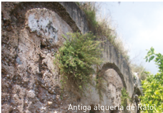
Antiga alqueria de Ràfol