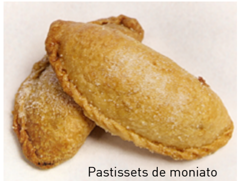
Pastissets de moniato

Així podem destacar els pastissets de moniato, els rotllets d'anís, la coca de mestall, l'arròs caldós, els bunyols de carabassa, l'arròs al forn, el caramull, les tonyes amb nous i panses, la coca cristina, el pebre en salmorra, els pebres farcits, la coca de pebre i tomaca o el torró de cacau.