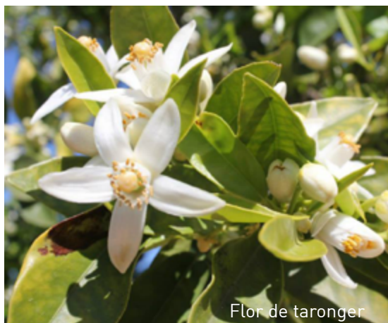
Flor de taronger

Existeixen camins i sendes per fer un recorregut per la vall i viure de prop aquestes sensacions.