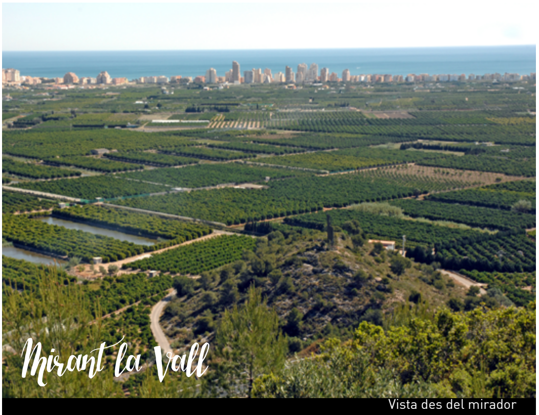
Vista des del mirador

Tavernes s'alça al cor de La Valldigna. Aquesta vall en forma de ferradura que mira a la mar, és terra d'aigua que naix del subsòl. Els nombrosos ullals i fonts naturals que brollen al territori, formen un paisatge únic. El visitant no pot deixar de veure el paratge del Clot de la Font.