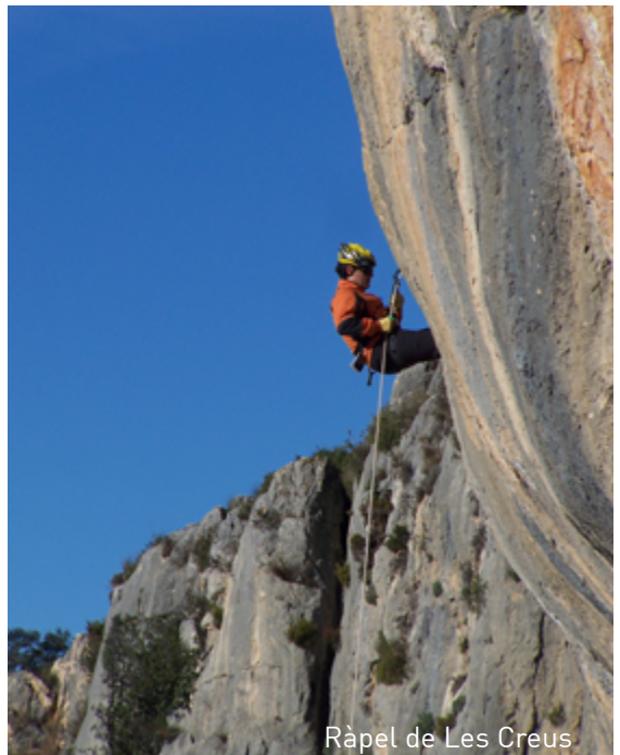
Ràpel de Les Creus

Tavernes es troba en un lloc ideal arropada per les dues muntanyes que la fan especial, Les Creus i L'Ombria.