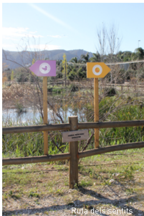
Ruta dels sentits

Existeixen camins i sendes per fer un recorregut per la vall i viure de prop aquestes sensacions.