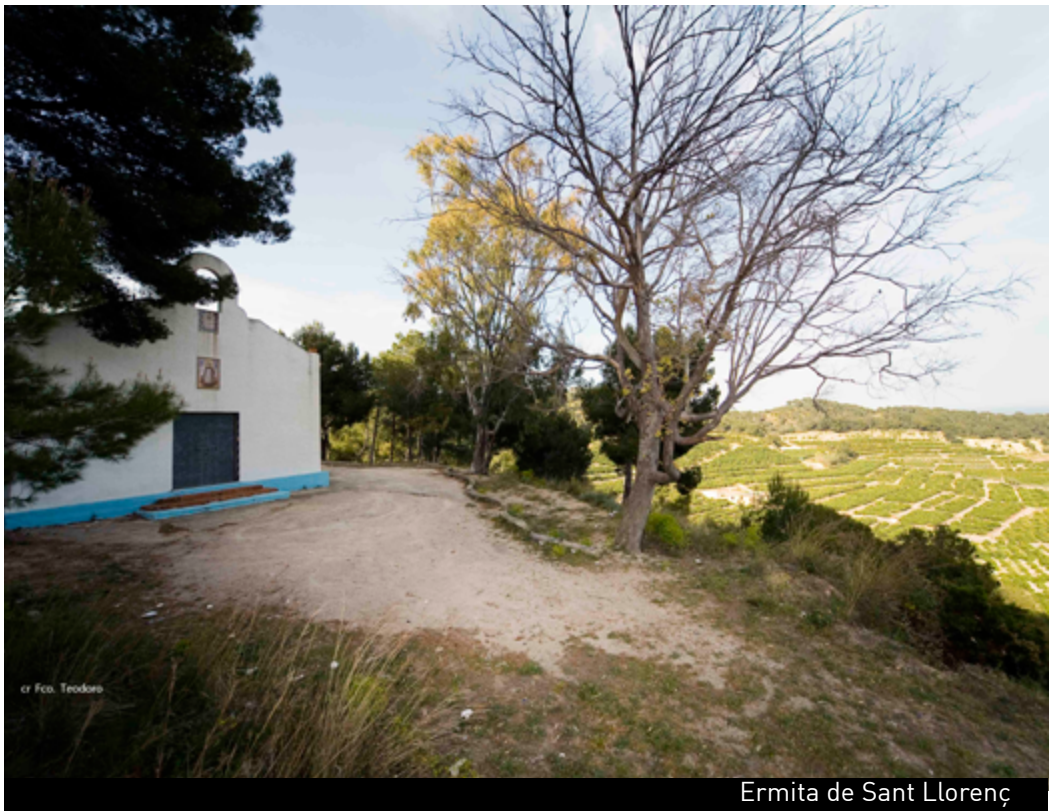
Ermita de Sant Llorenç

El traçat de les nostres muntanyes fan possible la pràctica d'esports com el senderisme, el ràpel o l'espeleologia. També es pot ascendir per una via ferrata o fer una passejada per les diferents sendes amb la bicicleta o muntats a cavall.