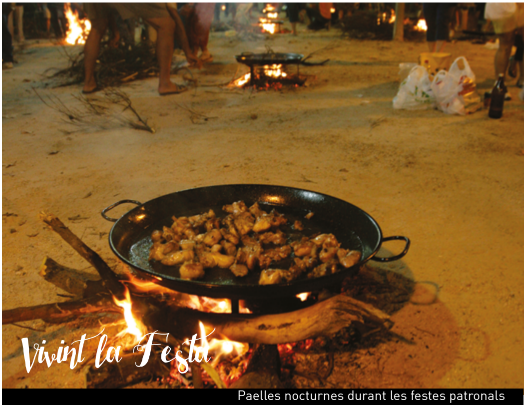
Paelles nocturnes durant les festes patronals

Tavernes de la Vallidigna viu al cor de la festa. Els seus habitants viuen amb passió la celebració de les falles, la música, la pólvora i el foc. El mateix foc que encén la foguera de Sant Antoni pel mes de gener o que permet fer el concurs nocturn de paelles pel setembre, coincidint amb les festes del poble. Unes festes carregades de tradició que comencen i acaben amb la processó del Crist de la Sang i de les que destacarem el concurs de xarangues, el ball de disfresses i l'ofrena de flors a la Mare de Déu de Lourdes.