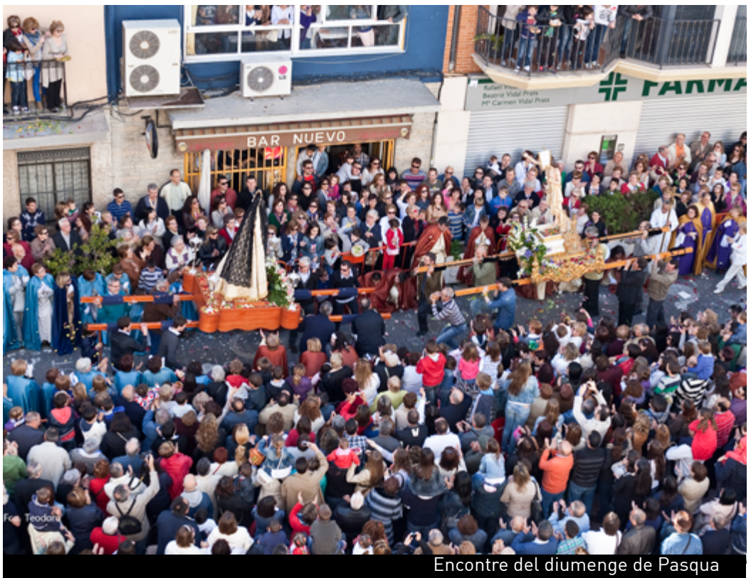
Encontre del diumenge de Pasqua

Un poble que destaca per la seua artesanía, els seus brodats, sinagües, cançons, vestits tradicionals valencians i vestits de comunió.