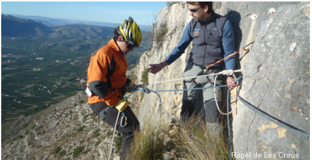
Ràpel de Les Creus

També hi ha tradicions que es mantenen vives com la pesca amb rall que torna d'estiu en estiu.