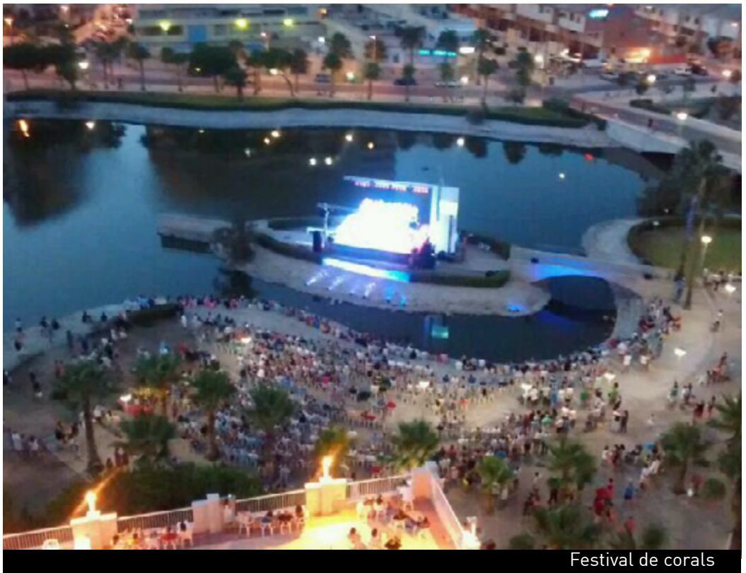
Festival de corals

En estiu també es celebra un festival de bandes per als músics més jòvens. En juliol té lloc el festival Pop al Carrer amb les propostes musicals i espectacles més alternatius i el festival de corals Cançons a la Mar que esdevé el primer diumenge d'agost. En setembre, durant les festes del poble, es celebra un concurs de xarangues. I quan arriba la tardor ens trobem amb el concurs de composició per a quintet de vent.