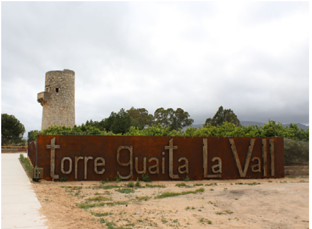
Torre de guaita