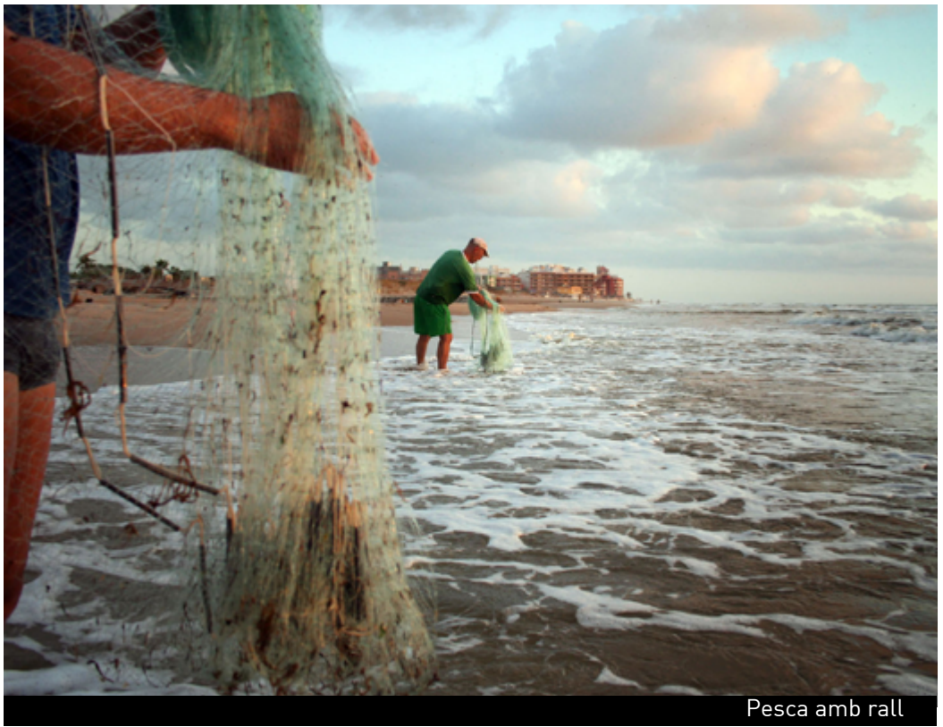
Pesca amb rall

També hi ha tradicions que es mantenen vives com la pesca amb rall que torna d'estiu en estiu.