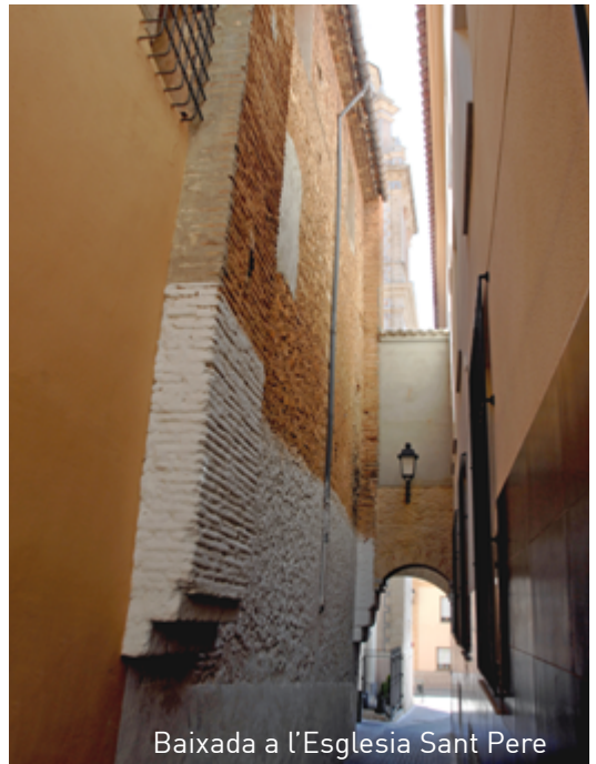
Baixada a l'Esglesia Sant Pere

En el centre històric es pot visitar l'església de Sant Pere Apòstol, el Calvari, el mercat municipal i la plaça Major on contemplem la façana de l'Ajuntament que data de 1879.