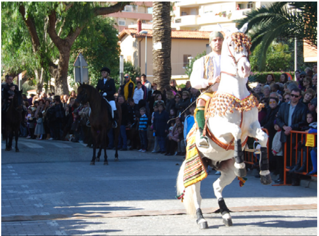
Festivitat de Sant Antoni