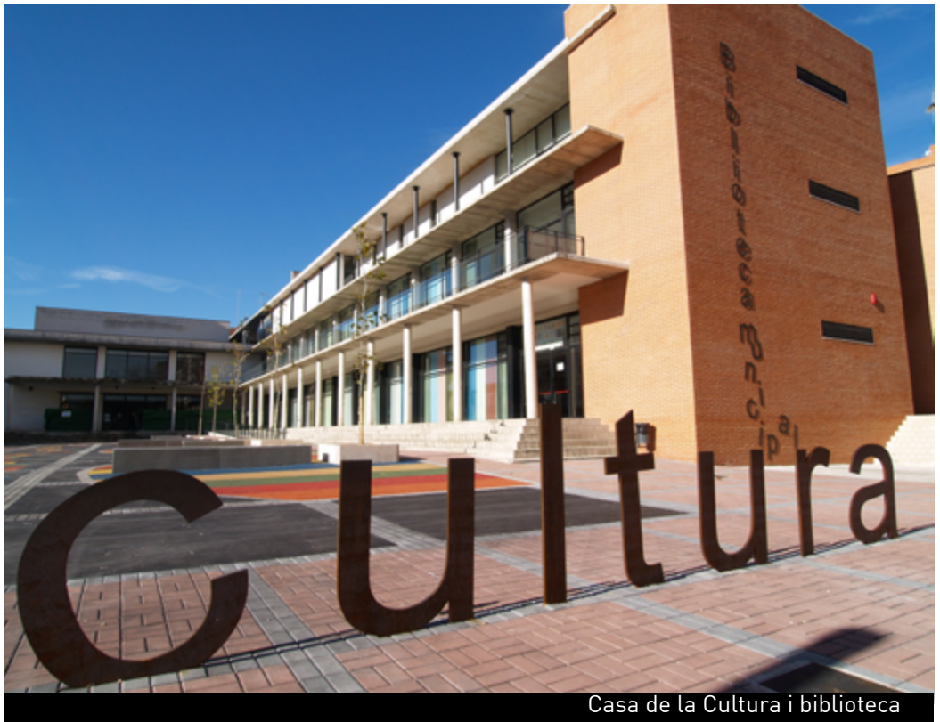
Casa de la Cultura i biblioteca