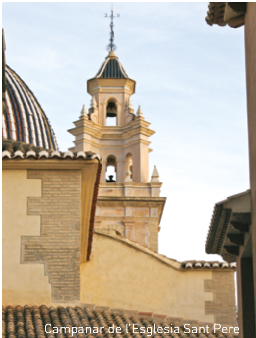
Campanar de l'Esglesia Sant Pere

Des de la Casa de la Cultura naix el passeig de Colon, que fa el recorregut de l'antic tren de via estreta que unia Carcaixent i Dénia. Als afores de la ciutat es trobaven els sequers d'arròs, convertits ara en zona residencial.