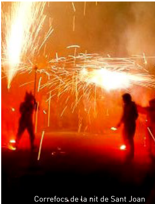
Correfocs de la nit de Sant Joan

Però és en l'estiu quan el temps permet fer més celebracions, començant pels focs de la nit de Sant Joan, els porrats del Clot de la Font i Sant Llorenç o les festes del Santíssim Crist de la Sang, patró de la ciutat.