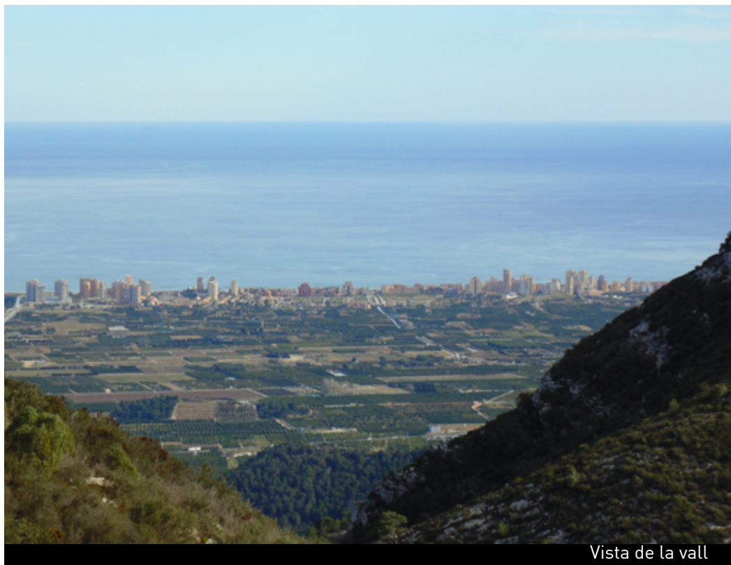
Vista de la vall