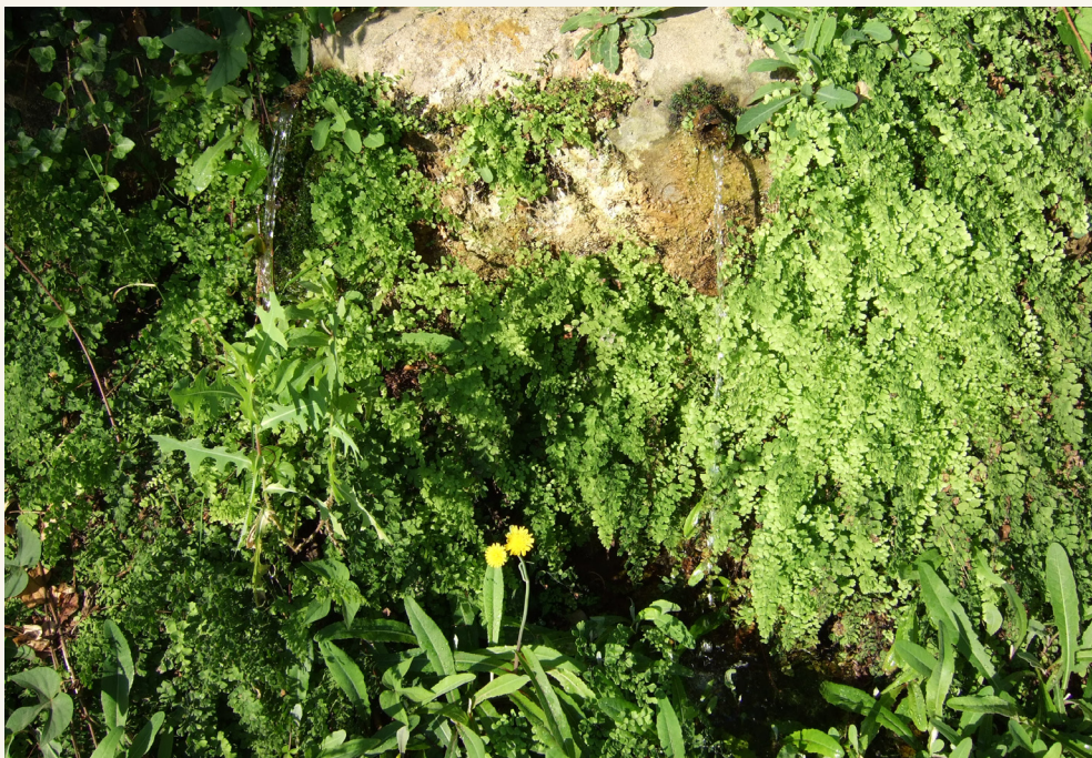
Detalle de la fuente