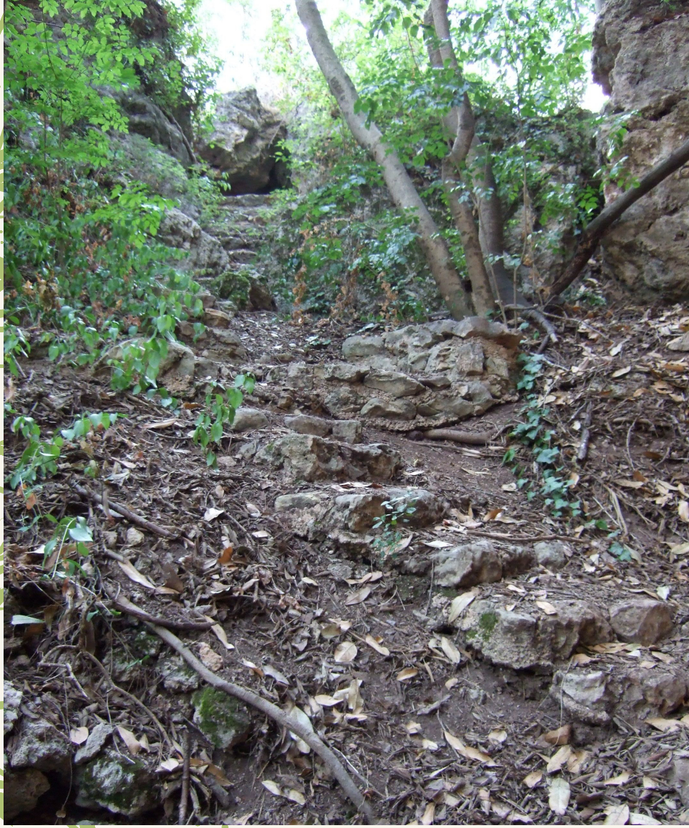
Sendero del paraje