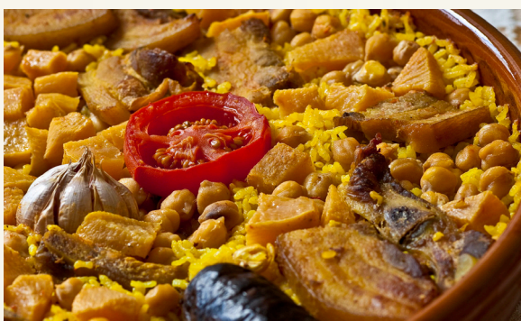
Arroz al horno