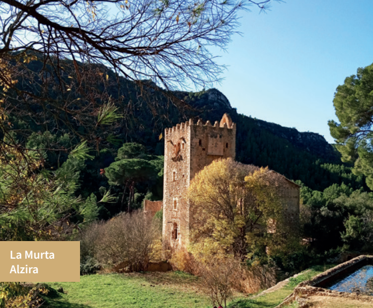
La Murta Alzira