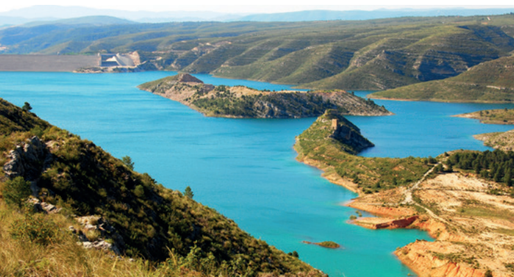
Embassament de Tous

La riquesa patrimonial de la comarca la completen monuments com les torres medievals de Benifaió i Alfarf, la Torre Senyorial d'Antella i l'Assut d'Antella, les ruïnes del castell dels Alcalans a Montroi, el palau del Marquès de Bèlgida (segle XVI) a Sant Joanet, l'Ajuntament de Sumacàrcer, emplaçat al palau dels Comtes d'Orgaz, el Museu Valencià de la Mel (MUVAMEL) i les restes del castell a Montroi i la Sénia de l'Alcúdia.